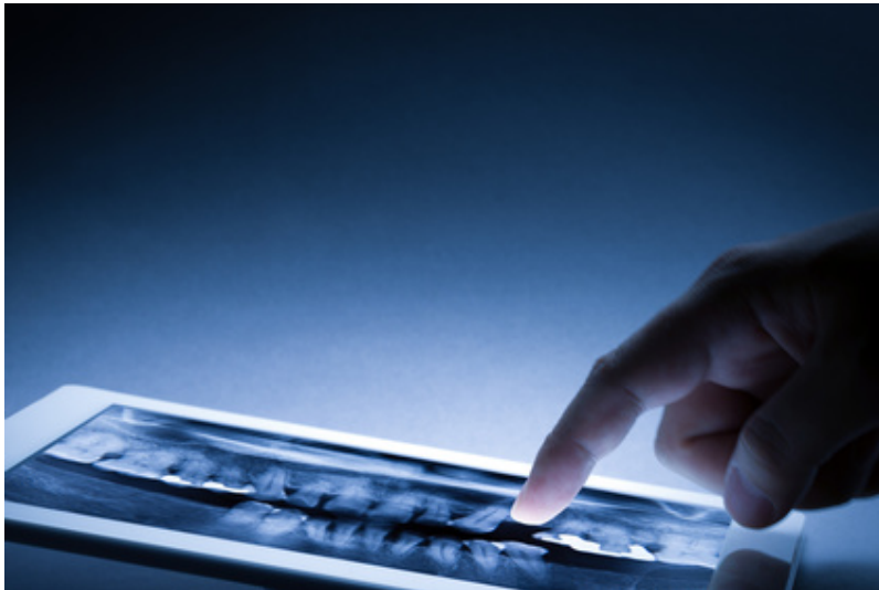
Der Gesundheitszustand des Patienten hat Auswirkungen auf die Haltbarkeit von Implantaten.

Einige Erkrankungen können den Stoffwechsel oder die Reaktionslage des Implantatträgers beeinflussen. Gefährdet diese Erkrankung den Erhalt der natürlichen Zähne, dann sind auch die Implantate in Gefahr. Manche Knochenerkrankungen können bei schwerem Verlauf die Haltbarkeit der Implantate beeinflussen. Alle diese Erkrankungen sind jedoch sehr selten und müssen auch nicht zwangsläufig zum Verlust der Implantate führen. Eine Abwägung bei schweren Erkrankungen sollte natürlich bereits vor der Implantation erfolgen.